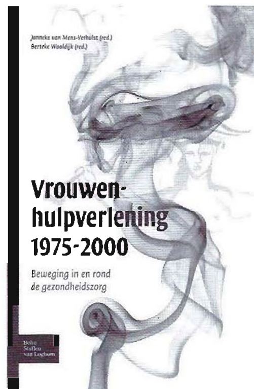
Cover van het boek over de geschiedenis van de vrouwenhulpverlening.

Het interviewmateriaal is aangevuld met historische beelden uit de jaren 1970 en 1980 en uiteindelijk verwerkt tot een documentaire over de geschiedenis van de vrouwenhulpverlening. Deze documentaire 'Vrouwenhulpverlening ontdekken en vernieuwen' heeft de interviews voor een breder publiek toegankelijk gemaakt en is op hetzelfde moment gepresenteerd als de publicatie van Mens-Verhulst en Waaldijk.